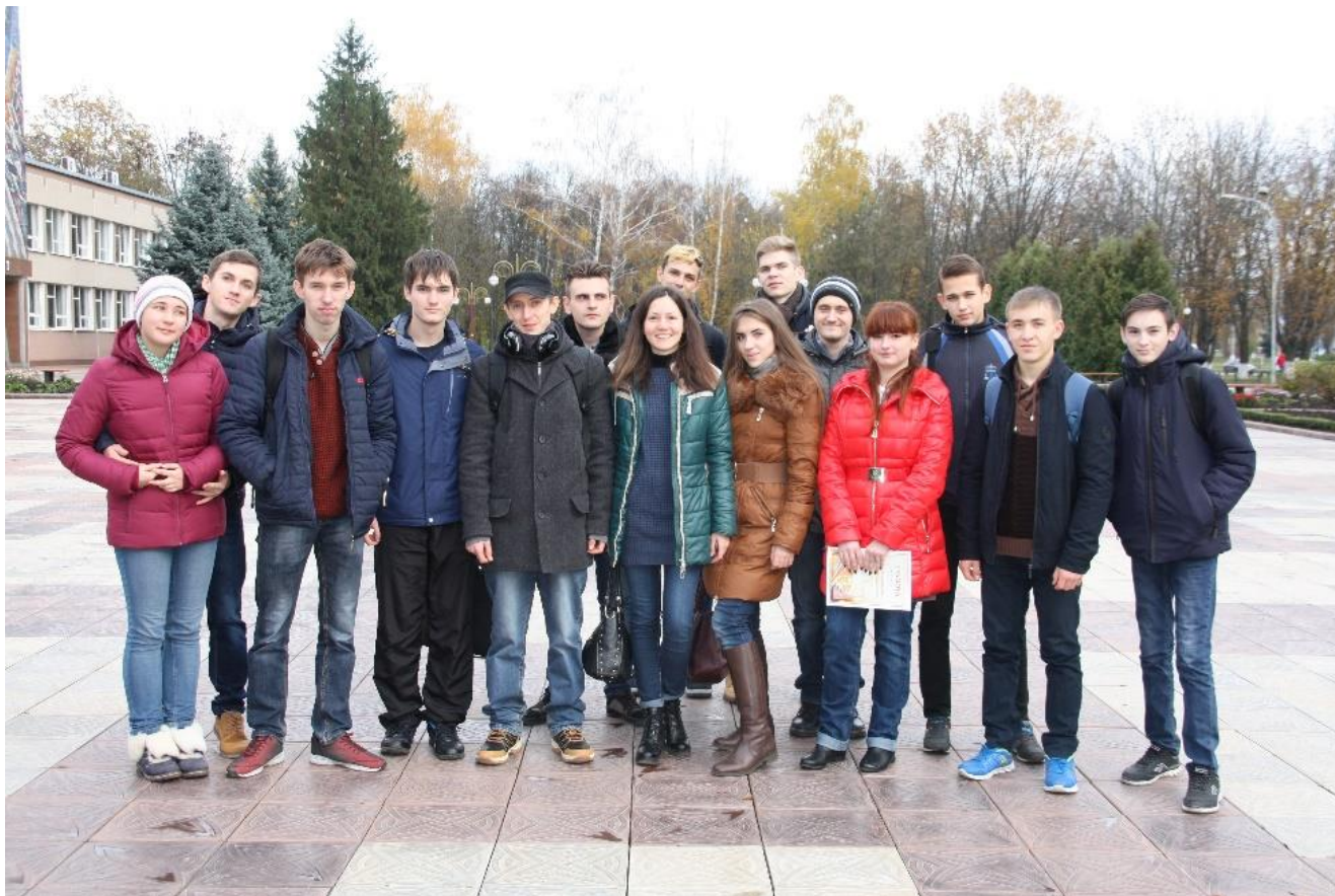
Фото учасників гуртка.

Активну участь в організації III Міжнародної науково-практичної конференції "Інформаційна безпека та комп'ютерні технології" приймає студентський науковий гурток «New Horizons» кафедри кібербезпеки та програмного забезпечення Центральноукраїнського національного технічного університету.